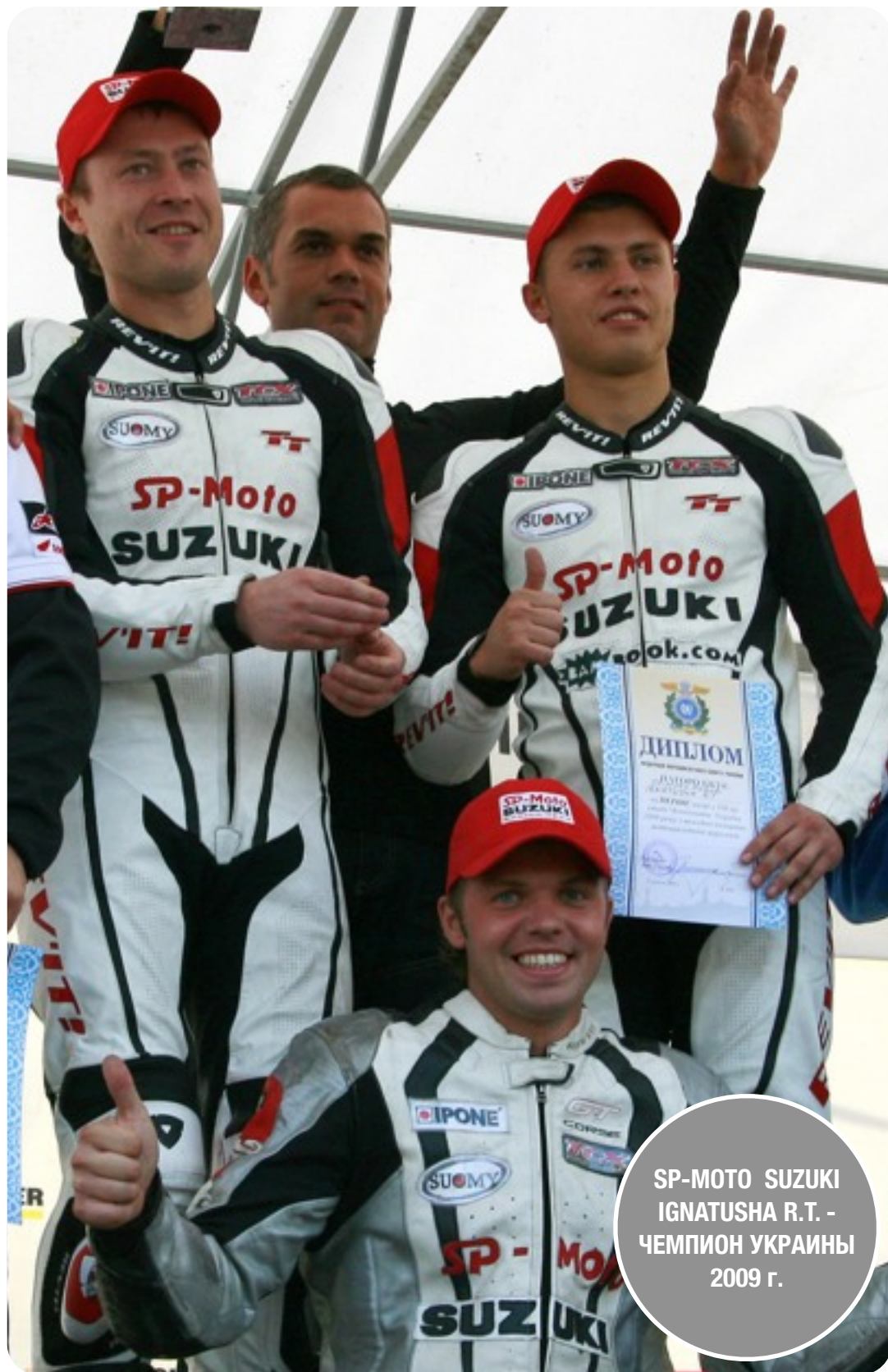
SP-MOTO SUZUKI IGNATUSHA R.T. - ЧЕМПИОН УКРАИНЫ 2009 г.